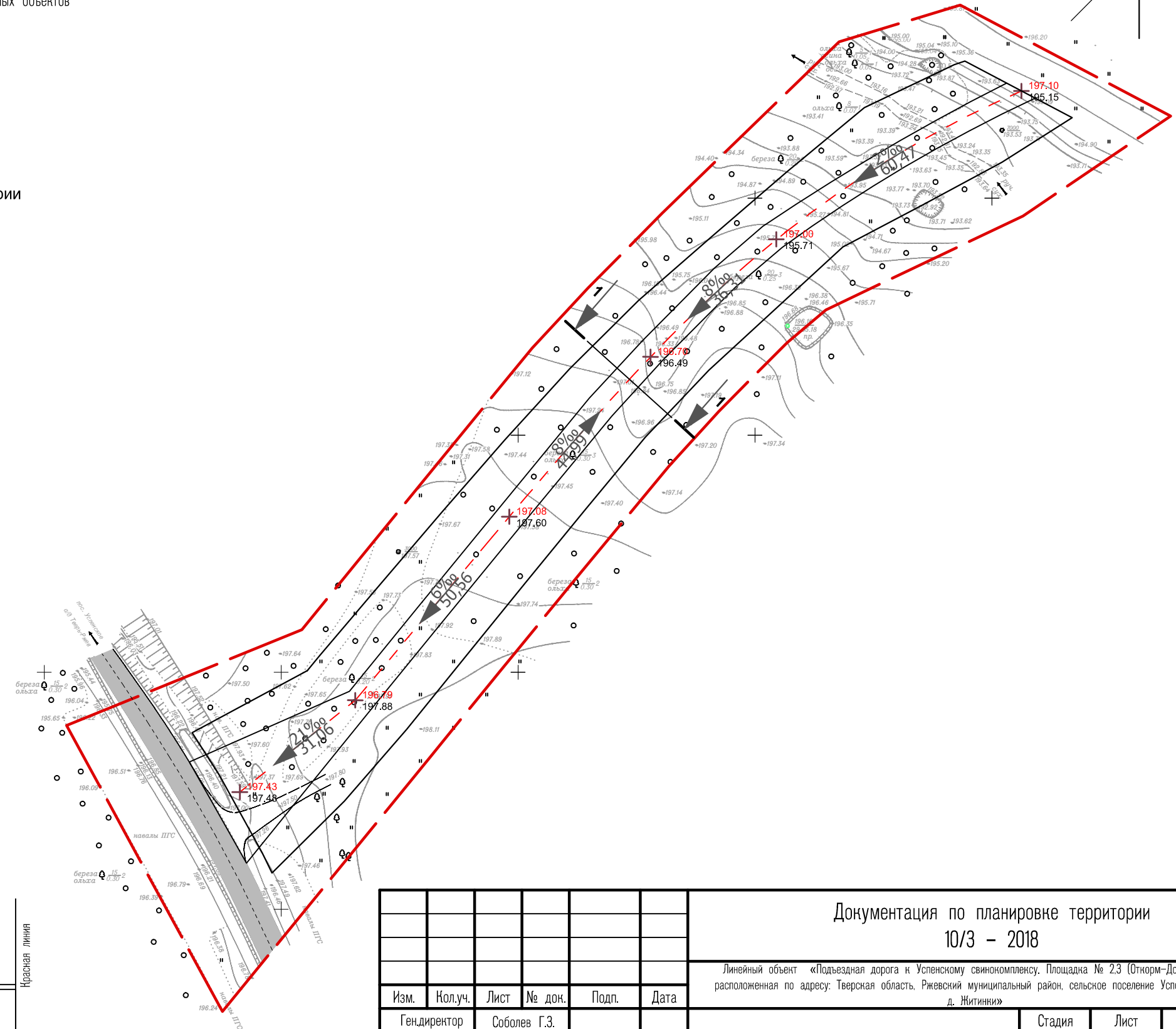
Планируемый поперечный профиль проезда (М 1:200) 1-1